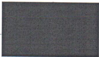
vedúci služobného úradu Ministerstvo financií Slovenskej republiky