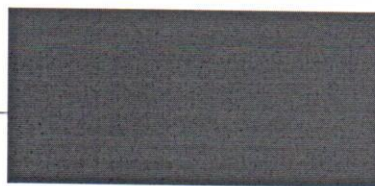
vedúci služobného úradu Ministerstvo zahraničných vecí a európskych záležitostí Slovenskej republiky

MINISTERSTVO ZAHRAJNÝCH VECÍ A EURÓPSKÝCH ZÁLEŽITOSTÍ SLOVENSKEJ REPUBLIKY Hlavná cesta 2 800 36 BRATISLAVA 37 66