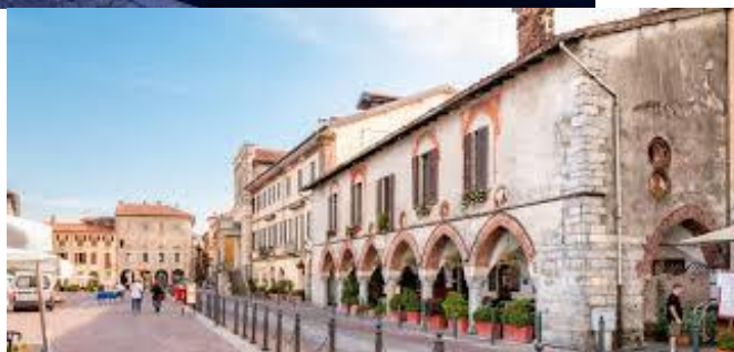
Arona , historické a zároveň moderné mestečko na brehu Lago Maggiore